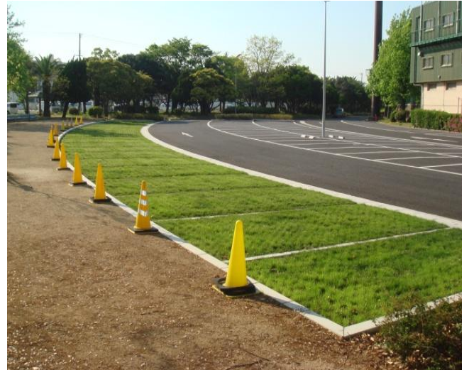
▲平成26年 和歌山県 紀三井寺公園(野球場)駐車場施工