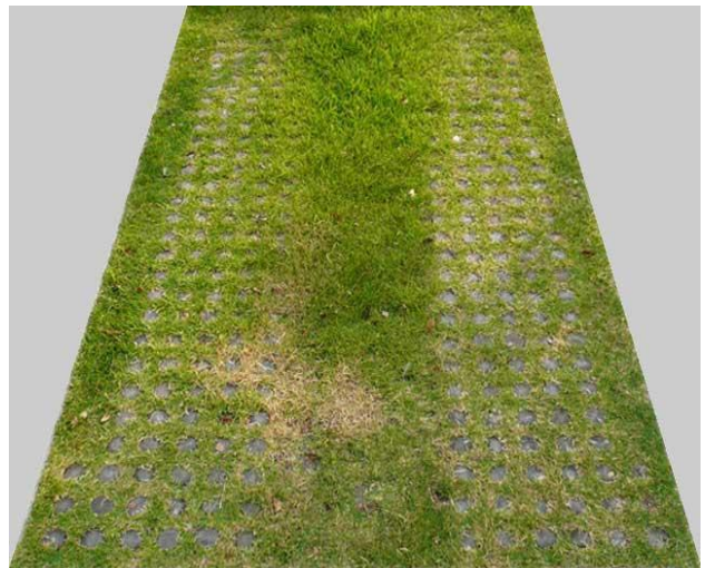
▲兵庫県庁敷地内 施工後3年経過

平成17年度より兵庫県庁敷地内で行われた芝生駐車場の実証実験に参加しました。都市部のヒートアイランド対策や都市景観の向上に効果が期待される「グラスパーキング」(芝生化駐車場の普及促進をめざしての実験です。産官学民の誰もが自由に参画できる「ひょうごGPフォーラム」が設置され、ターフ・ウッド工法は実験の結果、高評価をいただきました。